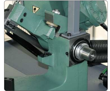
Eccentrico per regolare la perpendicolarità dell'archetto