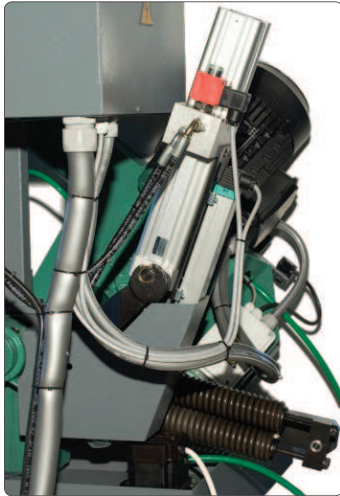
Cilindro idraulico movimento archetto