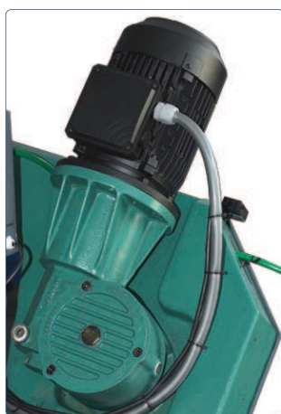
Motore in posizione verticale per ridurre l'ingombro e trasmissione con riduttore 1:40 in bagno d'olio