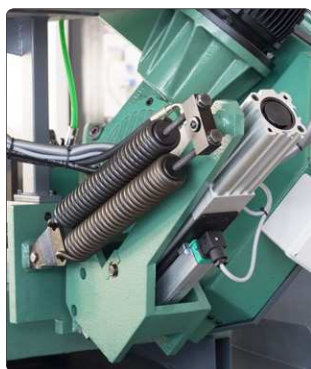
Cilindro idraulico con doppia molla di sicurezza e potenziometro lineare