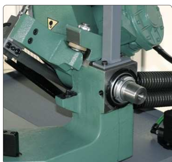
Eccentrico per regolare la perpendicolarità dell'archetto