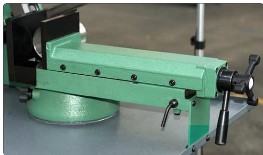
Morsa ad accostamento rapido con lardone registrabile