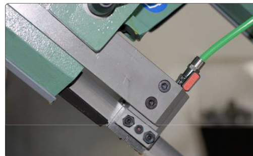
Pattini guidalama con piastrine in acciaio widia registrabili