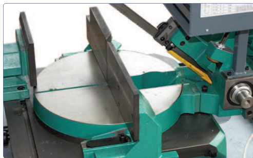
Ampio piano di appoggio circolare ruotante in solido con l'archetto per un sostegno ottimale del pezzo da tagliare