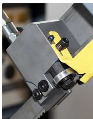
Pattini guidalama con piastrine in acciaio widia registrabili