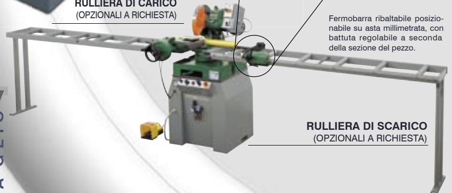
RULLIERA DI SCARICO (OPZIONALI A RICHIESTA)