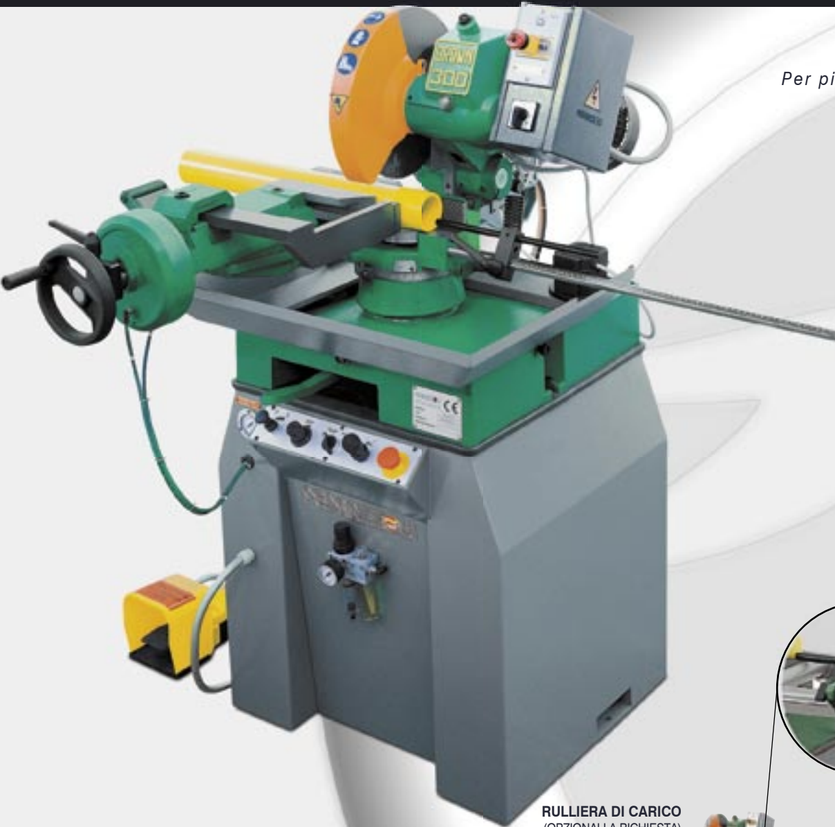
RULLIERA DI CARICO (OPZIONALI A RICHIESTA)

Grande affidabilità Per pieni e profilati metallici